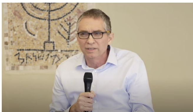
פרופ' ברק מדינה, חבר הפורום, בהרצאה פומבית, אפריל 2023