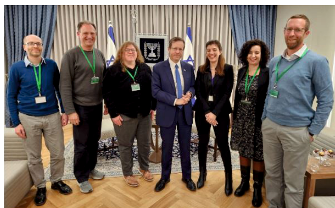
חברות וחברי הפורום במפגש עם נשיא המדינה, יצחק הרצוג, בחודש פברואר 2023.