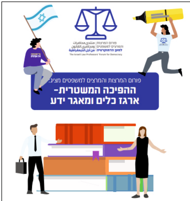
ראו למשל מסמך מאגר הידע וארגז הכלים <<<

חברי הפורום צילמו סרטוני הסבר, הקליטו פודקאסטים, קיימו ובינארים ויזמו עשרות אירועים וכנסים. בין היתר, פרסם הפורום את תכניו גם בשפה הערבית ובשפה האנגלית כדי להנגיש את המידע גם לאוכלוסייה הערבית וגם ליהדות התפוצות ולקהילה האקדמית העולמית. חלק מהמסמכים אף מתורגמים לרוסית ולצרפתית.