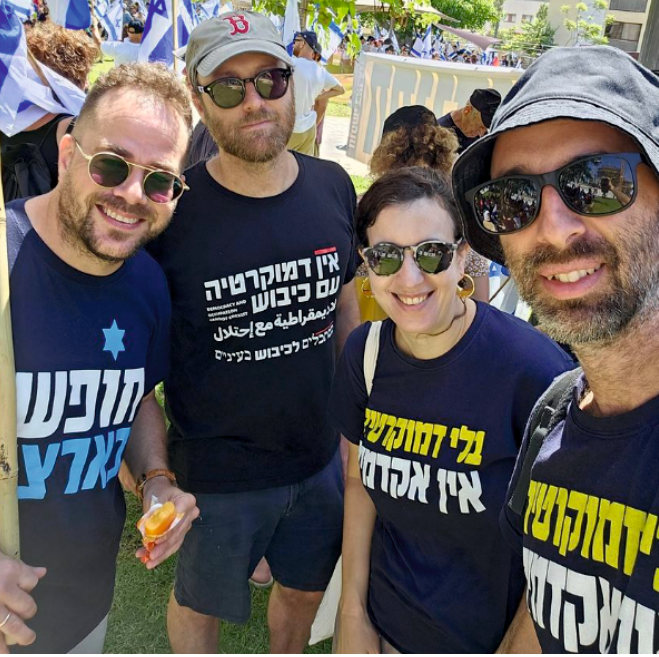
פרופ' אליאב ליבליך, פרופ' תמר הוסטובסקי ברנדס, פרופ' אדם שנער ופרופ' יניב רוזנאי, חברי הפורום, משתתפים בהפגנה, יולי 2023