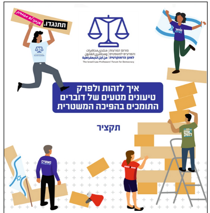
ראו למשל מסמך טיפים <<<